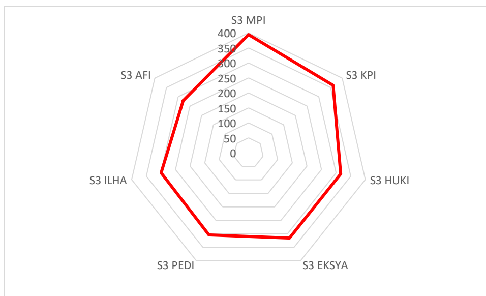
Gambar 2. Pemosisian Akreditasi Program Studi Magister

Secara grafis pemosisian akreditasi program studi berdasarkan hasil AMI-PT di atas digambarkan sebagai berikut: